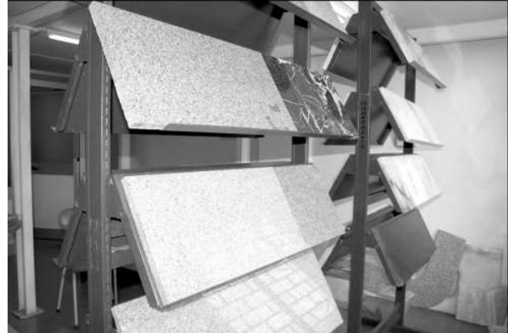
ጊንዳዕ - ንሰደድ ዝተዳለወ ጸዕዳ ወርቂ (እምነበረድ)

እሞ ኣብ ውሽጥናኸ ናበይ ኢና ክንከይድ? ንኺድ ናብቲ ምድረበዳ፣ ንኺድ ናብቲ ኣኻውሕ። ለምለም ደኣ እንታይ ክንከይድለ- ለምለምንድዩ ባዕሉ። ከውሒ ዘልምዕ ሓይሊ ኣብ ውሽጥና ኣሎ'ሞ ንኺድ ናብቲ ቀላጥ ጎልጎል። ዋላኻ ደኣ ባዕላ ዝነጠበት ዘርኢ'ኳ ትበቐሎ፣ እምነት ሓዊስና ኣብቲ ከውሒ ከይተረፈ ዘርእና ነብቐሎ። ንኺድ፣ ንኺድ ናብቲ ያና። ከተማ ደኣ እንታይ ክንከይድ ድሮ ከቲሙንድዩ። ንኺድ ናብቲ ቁሸት ርሻን ንህነጸሉ። ሃብታም ደኣ ሃብቲሙንደኣሉ፣ ንኺድ ናብቲ ድኻ ሓገዝ ንግበረሉ። ቃጽዖ ደኣ ውሑድንድዩ ጸዕሩ፣ ንኺድ ናብቲ ሰጣሕ ጎልጎል ቀጠልያ ንቐይሮ ሕብሩ። ማእከል ደኣ ሓላዊኡ ኩሉ፣ ንኺድ ናብቲ ዶባት ከይድፈር ክብሩ። ሎሚ ደኣ ተፈሊጡንድዩ ሕብሩ፣ ንኺድ ናብ ጽባሕ ሰንደቕና ንቐብኣሉ። ትማል ደኣ ሓሊፉ'ድዩ ዛንታና ሓዘሉ፣ ምስሊ ጽባሕና ሎሚ ነጽሮ ንድፉ። ብርሃን ደኣ ድሮ በሪሁ'ሎ፣ ንኺድ ናብቲ ደባን ባና ኳዕ ነበሎ። ለማጽ ደኣ ለሚጽ እንከሎ፣ ንኺድ ናብቲ ኩርኳሕ ምድሪ ቤት ነምስሎ። ቀረባ ደኣ ሃካይ'ኳ ይኸደ፣ ንኺድ ናብቲ ርሑቕ ሕልምና ነግህዶ!