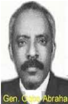
Gen. Ogburn Abrahah

ካብ ቀዳማዊ ዳኤራዩ ዝገድድ ብሂል፡፡ መበገሲ ኩናት ክጽናዕ ኣለዎ፡፡ መበገሲ ኩናት ድኣ ርእሰ ግሉጽ እንድዮ፡፡ ባድመ ኣብ ክሊ ግዝኣታዊ መሬት ኤርትራ ዝሰፈራ ንባብ ካርቶግራፊ ምጻኑ፡ መግዛእታዊ ሰነዳት ዝሕብሩዎ ሓቂ ኢዮ፡፡ ህዝቢ ብተደጋጋሚ ብሰብ-ስልጣን ወያነ ዝበጽሖ ዝነበረ በደላት ናብ መንግስቲ ጥርግኑ የቕርብ ነይሩ፡፡ ወያነ ንጉሆ፡ ንጉሆ ናይ ምጥራር መስርሖ ይቕጽል ስለ ዝነበረ፡ መንግስቲ ኤርትራ ነዚ ጉዳይ ፍጹም መዓልቦ ክገብረሉ፡ ኣብ ናይ ዘተ ጽምዶ ኣትዩ ብደረጃ ሚኒስተር ምክልኻል ዝምራሕ ዝለዓለ