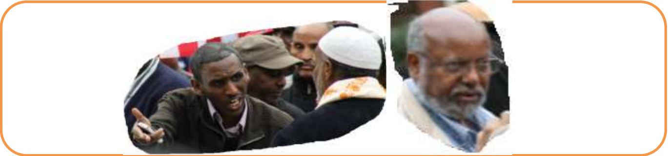
ላዕለዎት ሕጹያት ተቋምርቲ፡ ብድሕሪ መጋረጃ.....