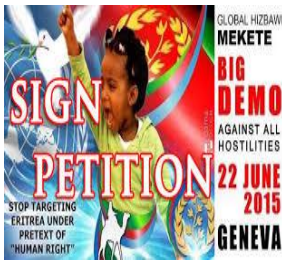
ዓቢ ፍልልይ ብዕድመን ሃገራዊ ሓላፍነትን።

ናጽነት ዝሰርኽቶም፡ መሳርሒ ጸላእቲ ነቲ ክንደይ ሰንክልናን መስዋእትን ዝተኸፍሎ ቃልሲ ሓፋሽ ጽልዋ ገበነኛታት ዝሓደሮም፡ ሕንኽ ክይበሉ ጸረ ዓላማ ናይዞም መንእሰይ ሰብዓታትን፡ ጸረ ሓፋሽ ደው ክብሉ ክትርእ ዘሕዝን።