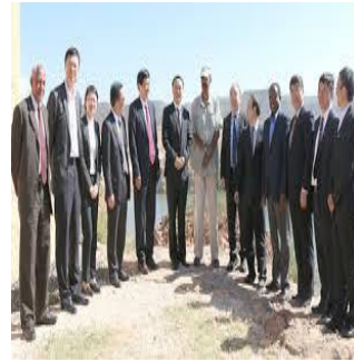
50 ዓመታት ኣብ ቃልሲ ንራህዋ ህዝቢ