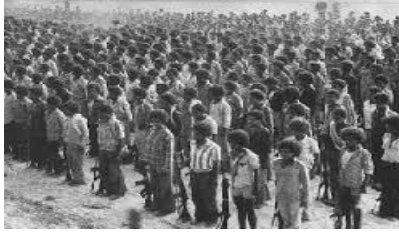
ተመልከቱ ኣብ ሞንጎ እዞን ክልተ ሰእሊ.