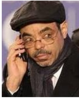
ቀ.ሚ. መለስ ዜናዊ