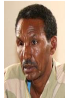
ብ.ጂ. ተኸለ ክፍላይ

ተቆጻጻሪ ጉጅለ ውድብ ሕቡራት ሃገራት ቅድሚያ ምምጽኡ፡ ከሰተ ጠዓመ አኮሎም (ወጅሀይ)፡ ምስ ብሪጋደር ጅነራል ተኸለ ክፍላይ (ማንጁስ)፡ ኣብ ዘይሕጋዊ ፍልሰት ደቂ ኣዳም ብሓባር ይሰርሕ ነይረ ኢሉ እንተዘይመስኪሩ፡ ኣብ ማእሰርቲ ክበል ምዃኑ ሓብርዎ!!!!!!! ቀዳማይ ሚኒስትር መለስ ዜናዊ፡-