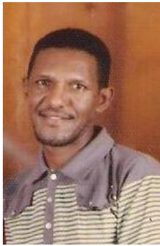
ከሰተ ጠዓመ አኮሎም