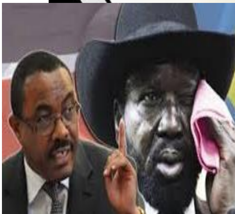
ቀ.ሚ.ሃይለማርያም ፕ.ሳልሻኬር ደሳለኝ