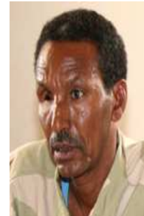
ከሰተ ጠዓመ አኮሎም