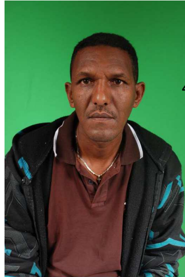
ከሰተ ጠዓመ አኮሎም ወጅሀይ፡ ወይ ኣንጎሶም ጠዓመ፡ መን ኢዩ?

44. እቲ ኣብ ናይ ዝሓለፈ ዓመት ባይቶ ጸጥታ፡ ኣብ ሓምለ 2012 ዘሕለፎ ውሳኔ እገዳ ዝቐረበ ጸብጻብ ተቆጻጻሪት ጉጅለ ውድብ ሕቡራት ሃገራት፡ ንጉዳይ ምስግጋር ዘይሕጋዊ ኣጽዋርን፣ ዘይሕጋዊ ምስግጋር ደቂ ሰባትን፣ ንግዲ ደቂ ሰባትን ዝምልከት፡-ብMatt Bryden Coordinator Monitoring Group somalia and Eritrea፡ ምስ ግዳያትን፣ ናይ ዓይኒ መሰኻኽርን ዝተኻየደ ቃለ-መሕትት ኢሉ ዝቐረበ፡ ደጊሙ ኣብ'ዚ ናይ 2013 ከም መርትዖ ኢዩ ቀሪቡ። ንዝርዝራቱ ካብ'ቲ ናይ 2012 ዝተወሰደ ክፋል ጸብጻብ፡- ጥብቆ ቁጽሪ 06 ተመልከት። ንምሉእ ትሕዝቶኡ ግን፡ ኣብ'ቲ ሰነድ ከይድካ ተወከስ።